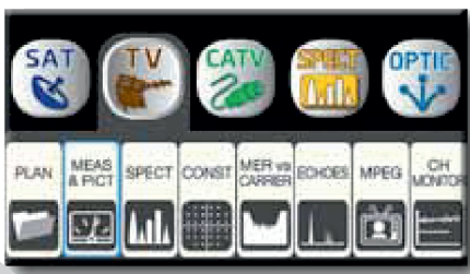
Neues ICON Navigations-Menu